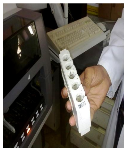
صورة ( ٣ )