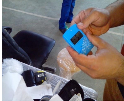
صورة (٥) معايرة الجهاز