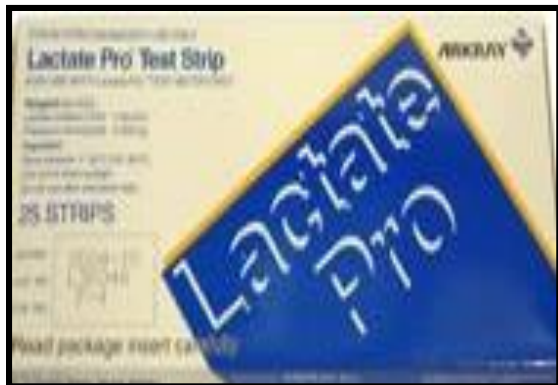
صورة ( ٢ )

الرياضي بعدها يتم الوخز بإبرة خاصة وفي هذا الخصوص تشير التعليمات المرفقة إلى عدم اخذ عينة الدم بالمرّة الأولى ويتم أخذها بالمرّة الثانية تجنبا لظهور أملاح اللاكتيك وبالتالي يؤثر ذلك على نتائج حامض اللاكتيك و توضع على سترب تيست يتم القراءة بشكل مباشر بعد ٦٠ ثانية من الجهاز مباشرة وكما مبين في الصور الاتية