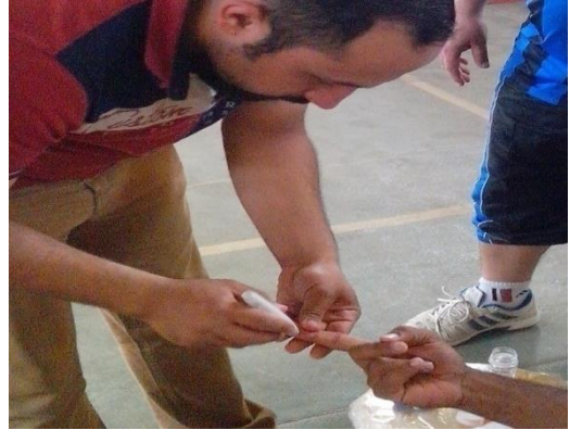
صورة (٧) وخز السبابة واخذ عينة الدم

بعدها تم سحب عينة من الدم مقدارها ( ٥ ) سي سي قسمت إلى جزأين الجزء الأول بمقدار (٢) سي سي وفيه مادة ( E.D.T.A ) المانعة للتخثر والجزء الثاني بمقدار (٣) سي سي وأخذها للمختبر لتحليلها واستخراج مستويات المتغيرات الوظيفية ومستوى الأنزيمات قيد الدراسة قبل إجراء عملية الإحماء أي وقت الراحة ، وبعد إجراء الإحماء قام الباحث بتطبيق اختبار تحمل الأداء للاعب المعد وبعد الانتهاء من الاختبار مباشرة تم اخذ عينات الدم وضعها في صندوق مبرد و إرسالها إلى المختبر .