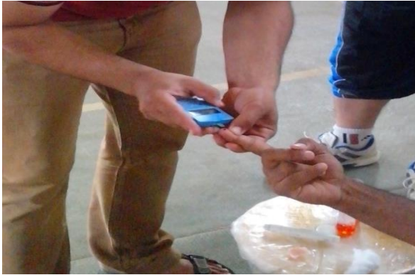
صورة (٨) قراءة الجهاز لعينة الدم