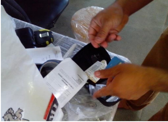
صورة (٦) استخراج الشريحة (الكت)

بدأت التجربة الرئيسية بقيام الباحث بتحديد محطات الاختبار على ارض الملعب حسب تسلسل المحطات وشرح تسلسل الاختبار لعينة البحث والإجابة على بعض التساولات وبعد ذلك تم قياس تركيز حامض اللاكتيك وقت الراحة بواسطة جهاز ( Lactic promete ) .